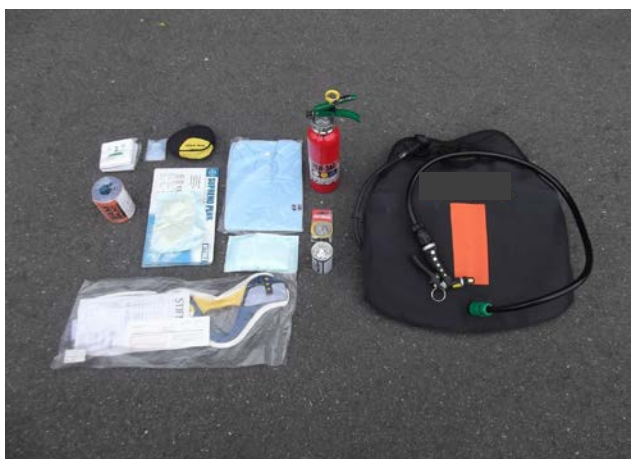
積載資機材例（消火用資機材、救急資機材等）