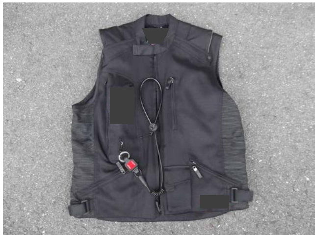
バイク用エアバックベスト例