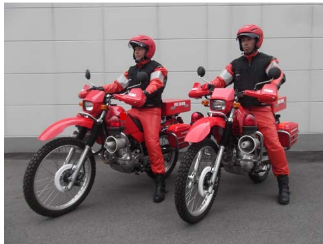
ベスト着用時の乗車状況